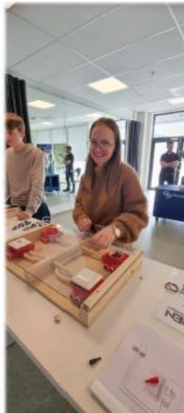
Jentene er interessert i elektro, på Vågsøy ungdomskule