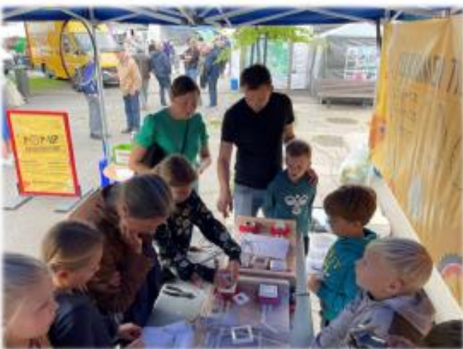
På uttæn til reodorklubben i Breim, Sandane dagane.