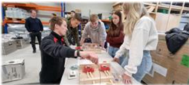
Rekrutteringsdag hos Josvanger elektro